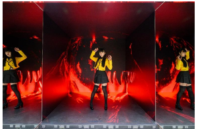
5面 LED ROOM