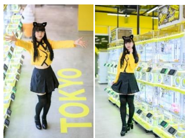
クレーンコーナー 1

1階から3階には、合計221台のクレーンゲームを設置いたしました。その中でも1階は国内最大級のミニクレーンコーナーを設置、106台のミニクレーンがフロアを彩ります。多種多様な商品を取り揃えることで、お客様一人ひとりの好みに応え、取るたのしさだけでなく、選んだり探したりするたのしさも提供します。