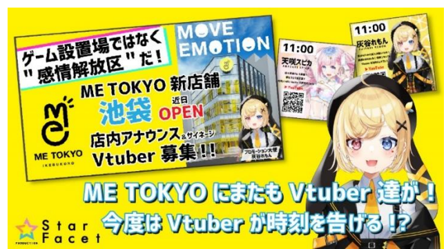
▲Star Facet Production (Prexy 株式会社)

ロリィタモデル。今年の春にはロリィタブランドのパリコレにも出演し、その活動は多岐に渡る。