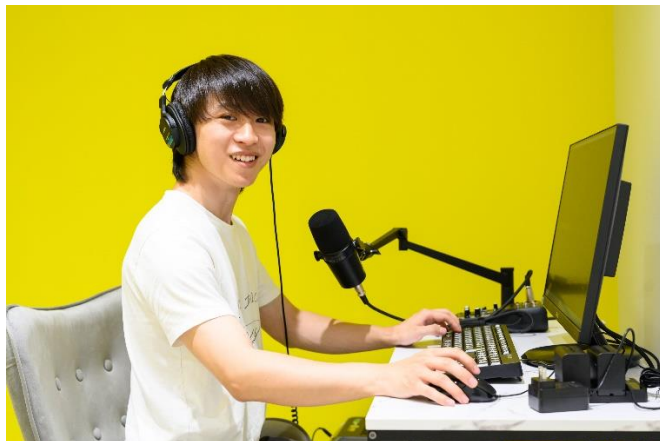
動画配信イメージ