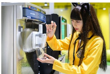
ドリンクコーナー風景