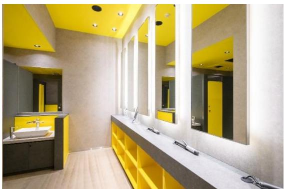
お手洗いスペース

有料ラウンジだけでなく、誰でもご利用いただけるお手洗いにも、男女ともにヘアセット設備を完備しております。性別に関係なく、誰もが広々としたスペースでメイク直しやヘアセットをゆっくり行える環境は、ME TOKYO のコンセプトに合わせた環境展開です。大切なイベント前にも是非活用ください。