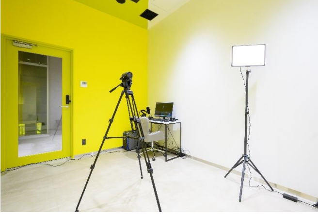
高速配信スタジオ風景

このスタジオは、高速インターネット環境を完備し、ストリーミングや動画撮影に最適な設備を完備しております。イエロー×ホワイトを基調とした明るくポップなデザインのジョーカーROOMは、クリエイティブなインスピレーションを刺激し、撮影中の気分を盛り上げます。自由な発想でコンテンツを制作できる環境を整えており、Z世代のクリエイターやインフルエンサーのみならず、みなさまにとって理想的な空間を提供します。