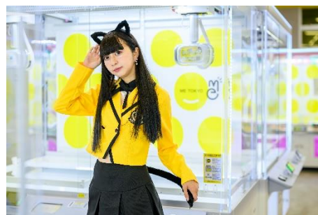
クレーンコーナー 3