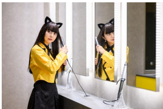
お手洗い レストルーム