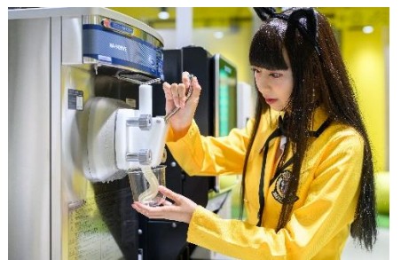
ドリンクコーナー風景