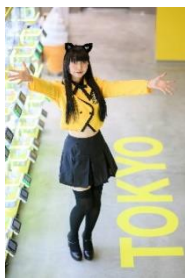
クレーンコーナー 1

1階から3階には、合計221台のクレーンゲームを設置いたしました。その中でも1階は国内最大級のミニクレーンコーナーを設置、106台のミニクレーンがフロアを彩ります。多種多様な商品を取り揃えることで、お客様一人ひとりの好みに応え、取るたのしさだけでなく、選んだり探したりするたのしさも提供します。