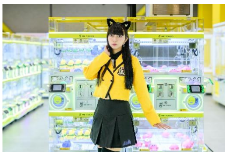
クレーンコーナー 2