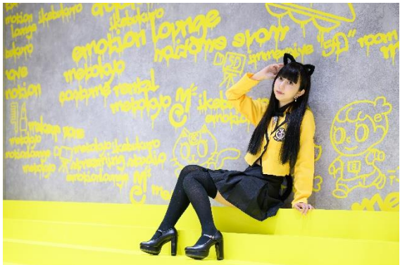
イベントスペース

Z世代のための新しい交流拠点、フリースペースが登場。最新トレンド情報の発信だけでなく、仲間同士で自由くつろぐことが出来るに使えるスペースです。池袋の中心で、リアルなコミュニティを形成し、最新の情報をキャッチ出来るこの場所は、Z世代にとっての情報発信基地としての一躍を担っていきたいと考えています。友達と集まり、コラボレーションの機会を広げ、新しいアイデアを生み出す場として、ぜひご活用ください。