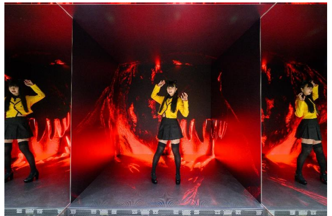
5面 LED ROOM