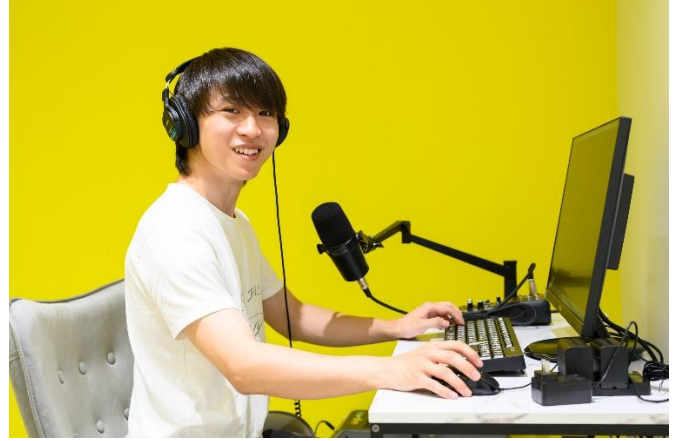
動画配信イメージ