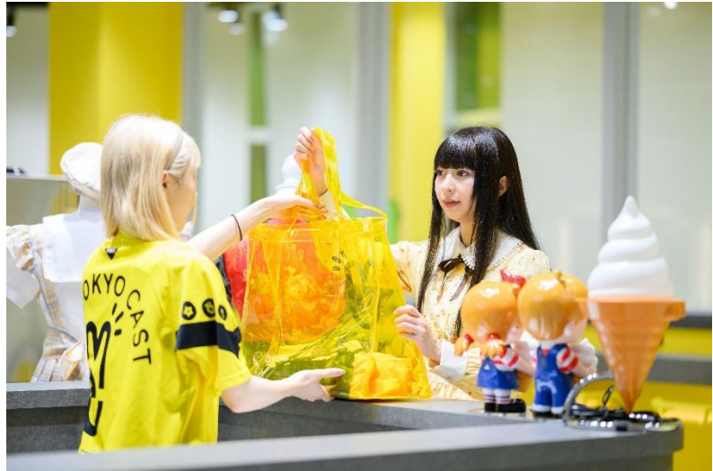
EMOTION LOUNGE 受付